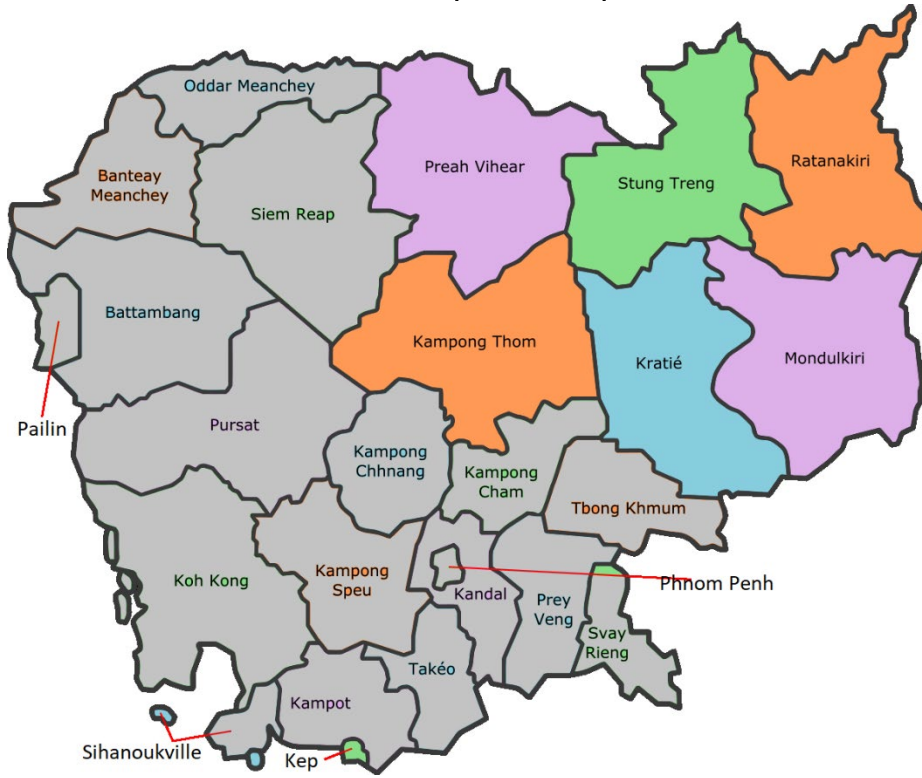
រូប ១ ៖ ខេត្តក្នុងប្រទេសកម្ពុជា